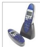
Dispositifs sans fils