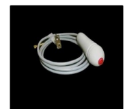
Poire d'appel pour lit, avec LED