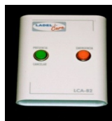
Terminal de chambre LCA-B2