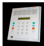
Terminal de zone LCH-GTH