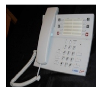
Terminal mains libres pour chambre